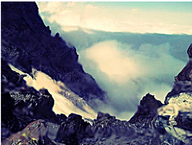
Sol üstte – Sol kapının hemen aşağısı

Üstte – Sırt rotası. Şu an rotada kırmızı oklar mevcut, sırttan sonra soldaki çizgiden ilerledim ve iki çizginin birleştiği nokta civarından döndüm.